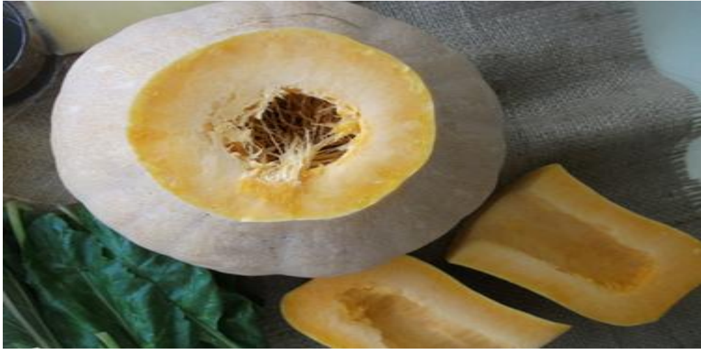
Resim 1. Karaağaç Kabağı

Kabağın seçimi; yapılan mülakatlarda ortaya çıkan ilk fark kabağın yetiştiği yere göre değişiklik göstermesidir. Türkiye’de kabağın en çok Adapazarı, Çukurova ve Hatay bölgesinde yetiştiğini söyleyen Tefik Bey, kabak seçiminin ve zamanının çok önemli olduğunu vurgulamıştır. Adapazarı’nda yetişen kabağın buradakilere göre çok farklı olduğunu belirterek, renginin turuncu, içinin daha yumuşak olması ve kireci kabul etmemesi nedeniyle burada kullanılmadığını dile getirmiştir. Hatay yöresinde yetişen kabaklar için ise;