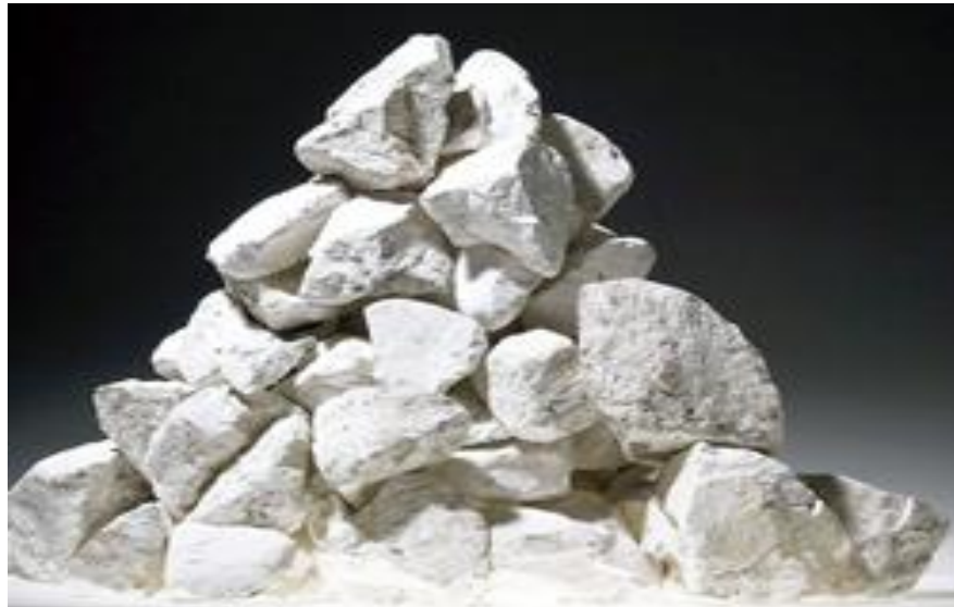
Resim 3. Kireç Taşı

Geçmiş ve günümüzdeki uygulamalara bakıldığında yapılanlar bu söylemi destekler niteliktedir. Balkan savaşlarında kolera salgını başlamış ve askerlerin çadırlarını dezenfekte etmek için söndürülmüş kireç kullanılmıştır (Erdem, 2013). Ayrıca su arıtmada en az klor kadar etkili olduğu da bilinmektedir (Sünter, 2009; Güler, 2004). Kirecin söz konusu yararları, aşağıdaki örnekte olduğu gibi, kültürümüze ait türkülerde yer alan öğütler arasına da girmiştir;